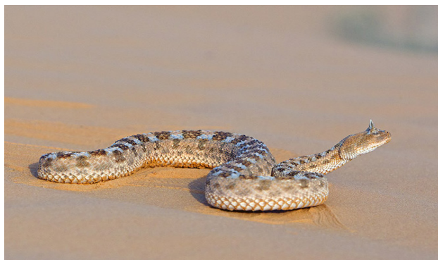
Figure 7 - Cerastes cerastes , photographié en Tunisie, dans le Parc national de Jbil, en mars 2011.

Une autre espèce, Cerastes boehmei , a été décrite en 2010 par Wagner et Wilms à partir d'un seul exemplaire du centre de la Tunisie repéré dans la collection du Muséum Alexander Koenig à Bonn. Cette espèce est mentionnée par Wallach et al. (2014). Cependant, comme l'un d'entre nous l'a déjà écrit (Geniez 2015) : « nous considérons Cerastes boehmei comme un synonyme junior de Cerastes vipera et l'unique spécimen connu comme une Cerastes vipera montrant une rare anomalie d'écaillure ».