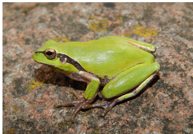
Figure 3 - Hyla carthaginiensis , mâle photographié en Tunisie, à Lebna, mai 2015.

ont relaté aussi les différences entre les Rainettes de Tunisie et les autres Rainettes méridionales, mais leur Hyla numidica est un synonyme plus récent de Hyla carthaginiensis (Dufresnes et al. 2019a), c'est d'ailleurs un nom indisponible selon le code international de Nomenclature zoologique, car il a été décrit sans désignation de matériel type (Dufresnes & Crochet 2020).