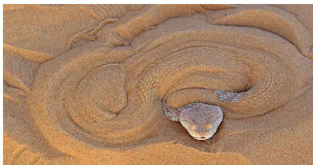
Figure 8 - Cerastes vipera , photographié en Tunisie, dans le Parc national de Jbil, en mars 2011.