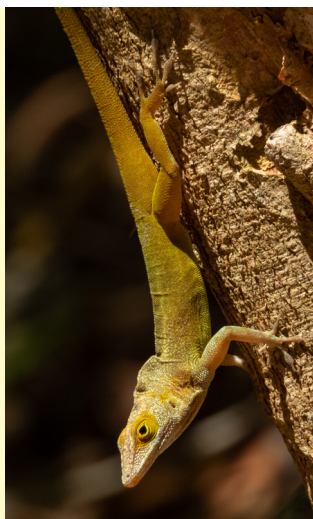
Figure 3 - Ctenonotus terraealtae caryae , photographed in Guadeloupe, at Les Saintes (Terre-de-Bas), in March 2020.

Figure 3 - Ctenonotus terraealtae caryae , photographié en Guadeloupe, aux Saintes (Terre-de-Bas), en mars 2020.