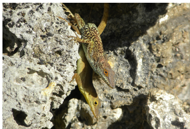
Figure 4 - Ctenonotus marmoratus chrysops , photographié en Guadeloupe, à La Petite Terre, en mai 2010.

Figure 4 - Ctenonotus marmoratus chrysops , photographed in Guadeloupe, at La Petite Terre, in May 2010.