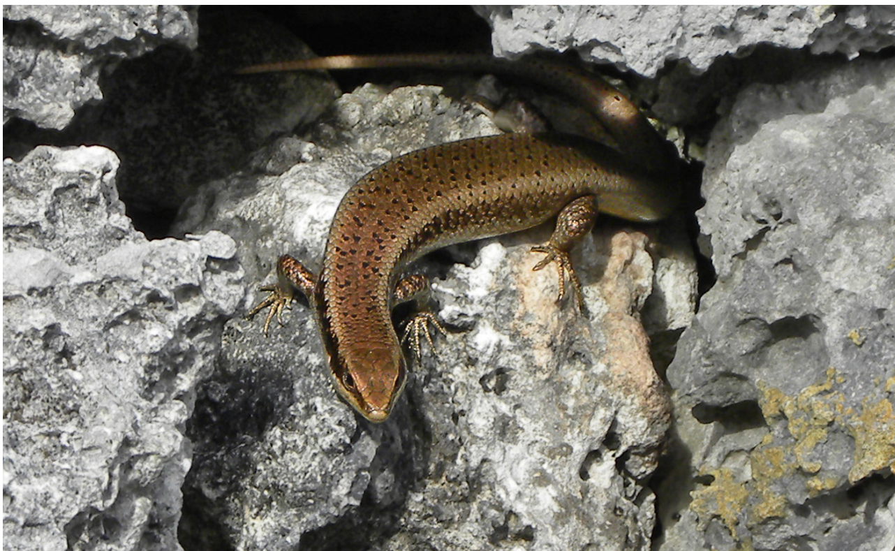
Figure 6 - Mabuya desiradae parviterae , photographié en Guadeloupe, à La Petite Terre, en mai 2010.