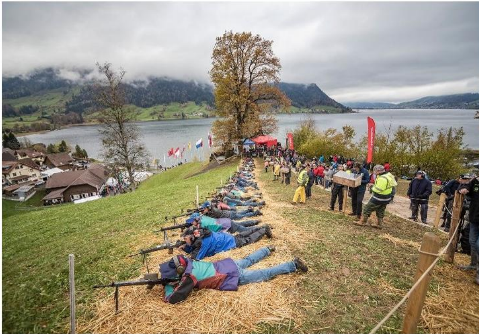
La ligne de tir lors du tir historique de Morgarten