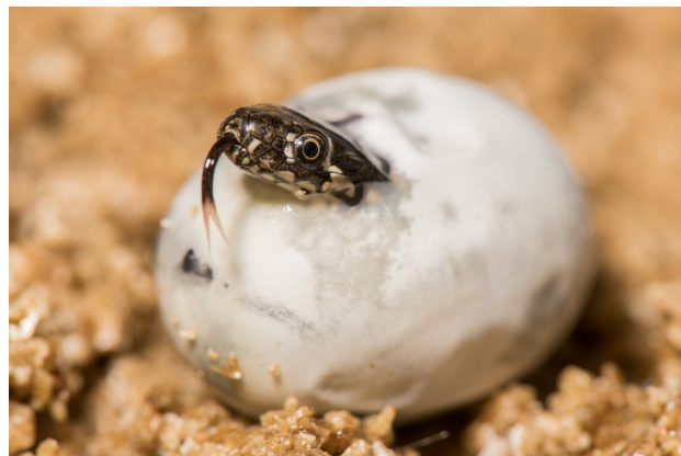
Eclosion d'une jeune Couleuvre vipérine le 24 août 2017 durant les expérimentations menées lors de cette thèse.

Pris tous ensemble, ces résultats suggèrent que, chez la Couleuvre vipérine, les réponses physiologiques plastiques des embryons à l'hypoxie de haute altitude pourraient faciliter l'expansion de l'aire de répartition altitudinale à travers le maintien des phénotypes corporels et des performances juvéniles. Néanmoins, une augmentation importante des températures en haute altitude ne pourrait permettre le maintien de l'espèce dans ces conditions.