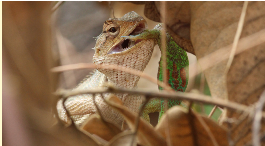
Figure 1 - Scène de prédation d'un adulte de Calotes versicolor sur un adulte de Phelsuma laticauda le 21 janvier 2021 sur les falaises de Manapany, dans la commune de Petite-Île, La Réunion.