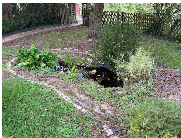
Photo 2 - Mare artificielle de la propriété où le spécimen axanthique de Pélodyte ponctué, Pelodytes punctatus , a été observé (France, Indre-et-Loire)