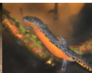
Triton alpestre