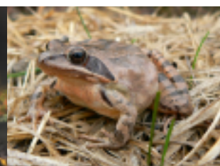
Grenouille agile