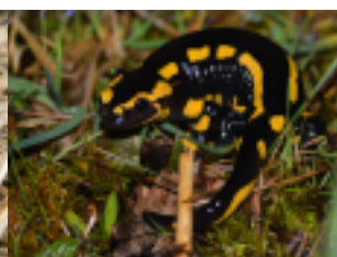
Salamandre tachetée