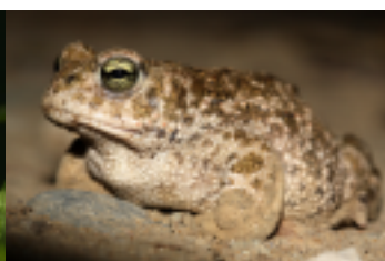
Crapaud calamite