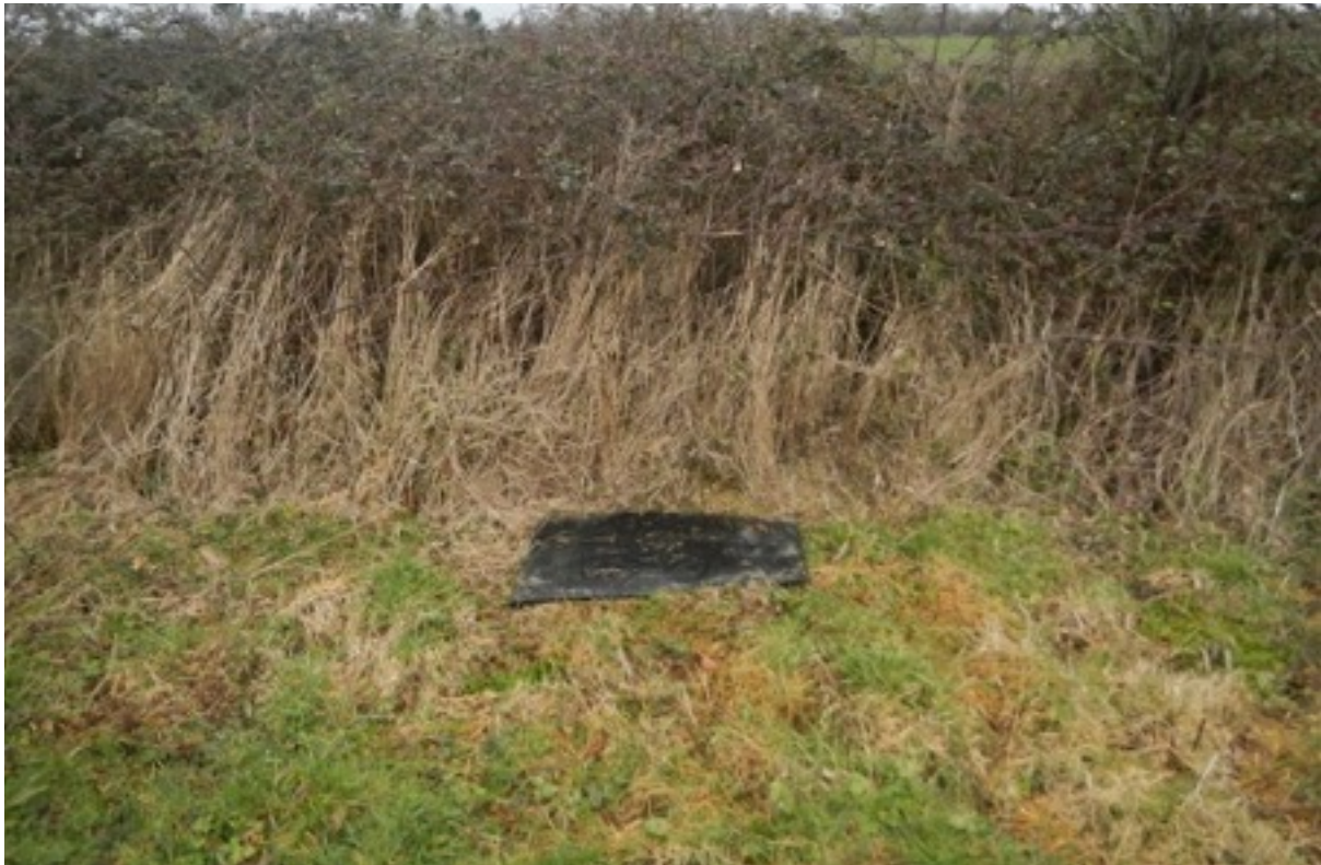
Figure 6. Illustration d'une plaque placée sur un milieu bordier (une haie). Les zones propices aux observations à vue sont situées en bordure (zone de végétation basse en contact avec les strates herbacées plus hautes)