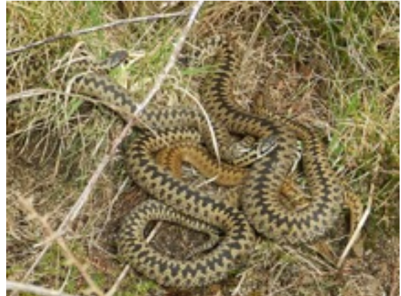
Figure 3. Vipères péliades ( V. berus ) en thermorégulation dans une lande.