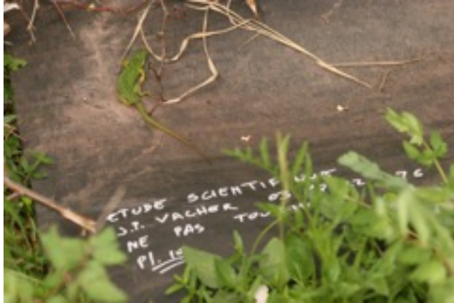
Figure 2. Illustration d'un tapis de carrière numéroté et marqué pour informer du suivi en cours.