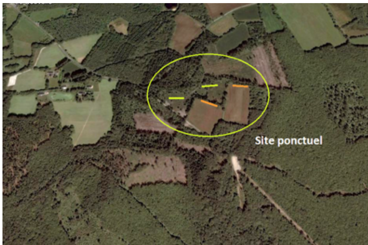
Figure 5. Exemple d'un suivi sur une aire bocagère et forestière avec un site ponctuel (quatre transects de 60m). Deux transects sont placés sur des lisières (orange). Les deux autres (vert) sont placés sur des milieux structurés en mosaïque à végétation basse.