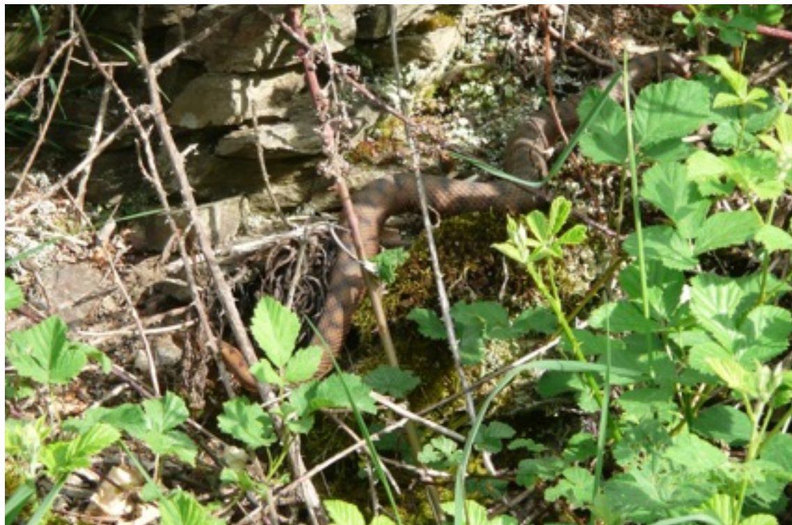
Figure 11. La détection à vue peut être difficile. Ici une femelle vipère aspic dans un petit roncier.