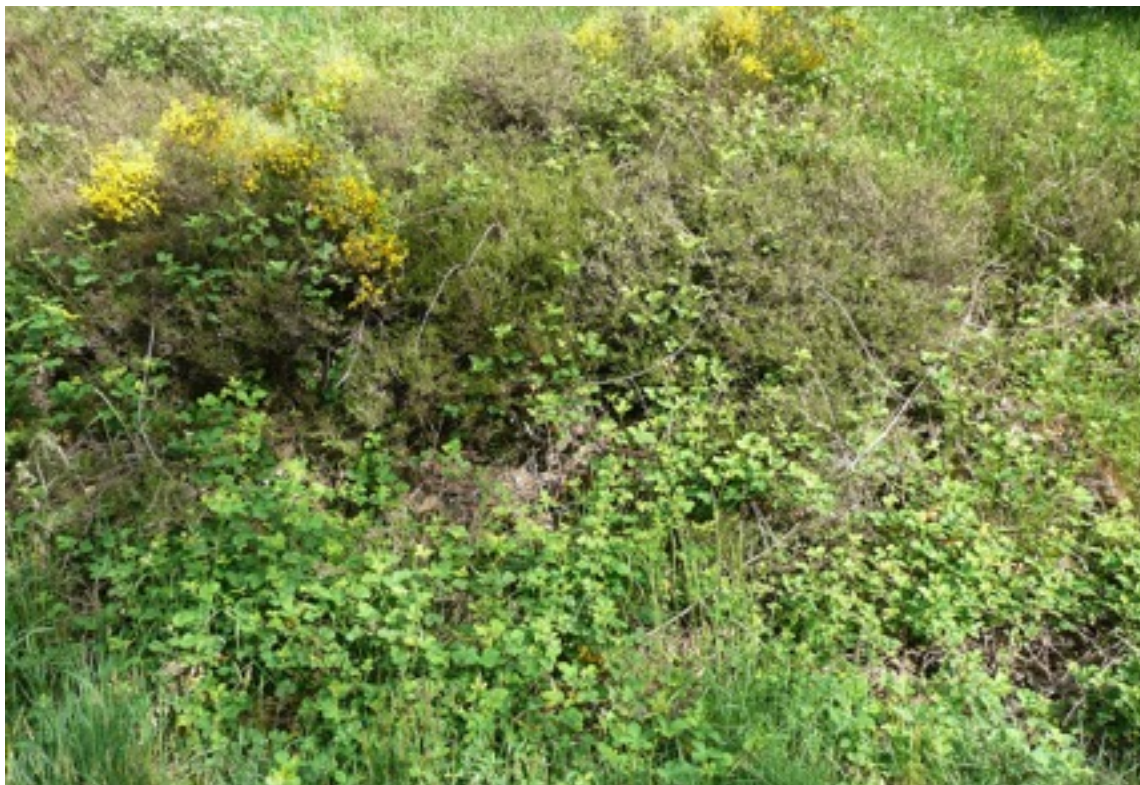
Figure 10. Les prospections à vue doivent être orientées vers les microhabitats favorables : petites placettes ensoleillées entourées de végétation basse (herbacée, roncier, arbrisseaux ou sous arbrisseaux). Ces zones sont également appropriées au placement des plaques.