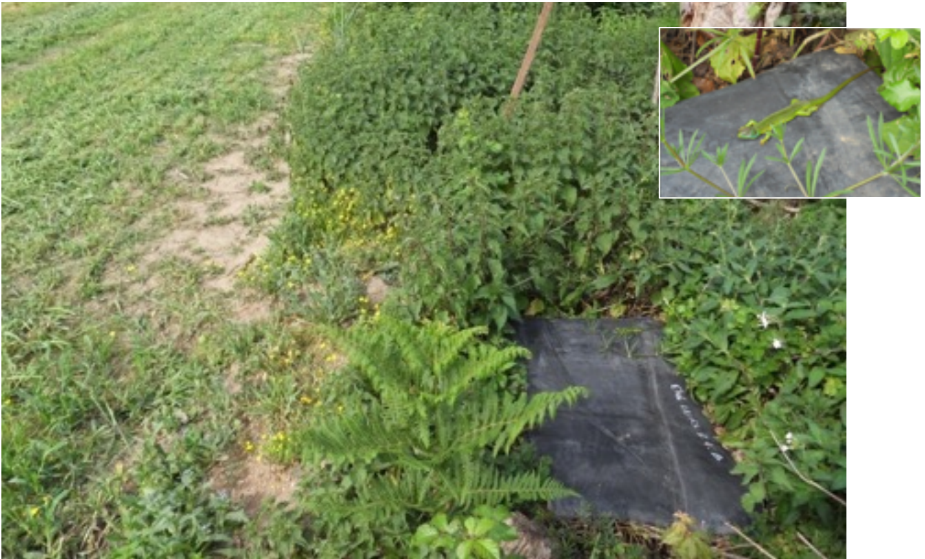
Figure 8. Exemple d'une plaque (tapis de carrière) positionnée en bordure de haie dans le bocage. Les tapis de carrière sont également utilisés pour la thermorégulation en surface par les lézards. Un lézard vert occidental mâle se chauffe sur l'angle de la plaque.