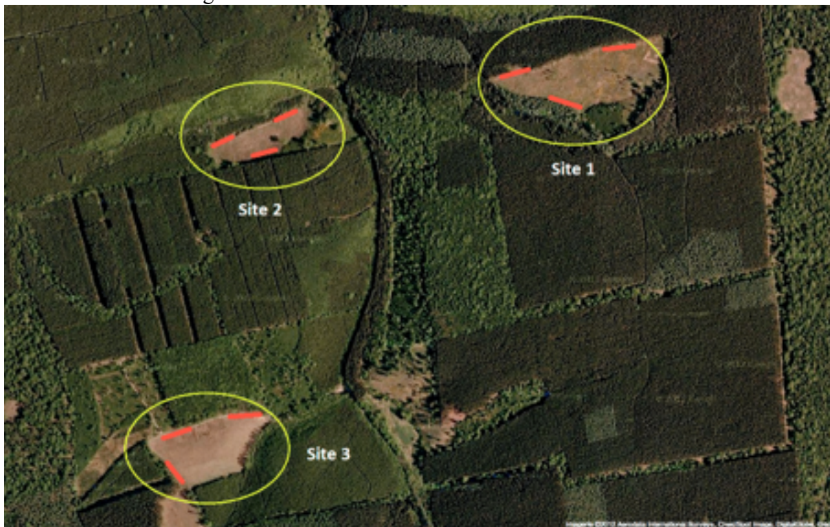
Figure 4. Exemple d'un suivi sur une aire forestière avec trois sites. Chaque site porte trois transects de 150m positionnés sur des lisières.

Sur l'aire choisie et selon vos possibilités, un ou plusieurs sites seront identifiés pour le placement des transects. Si plusieurs sites sont suivis, ils sont alors distants d'au moins 500m . Au sein d'un site, si plusieurs transects sont placés, ils sont distants d'au moins 50m environ . De nombreuses configurations sont possibles selon vos possibilités. Deux exemples sont illustrés sur les Figures 4 & 5.