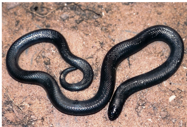
Figure 4 - Atractaspis microlepidota . Spécimen de Dielmo (Sénégal).

Onze spécimens ont été étudiés, tous provenant du Sénégal (Tableau IV). Sept spécimens (63,6 %) présentaient une proie dans leur tube digestif, mais celle-ci n'était identifiable que chez cinq spécimens (45,5%). Dans trois cas il s'agissait de crapauds Sclerophrys xeros , dans un cas du serpent Psammophis afroccidentalis Trape, Böhme & Mediannikov, 2019, ce dernier plus long que son prédateur, et dans un cas du Lacertidé Latastia longicaudata (Reuss, 1834).