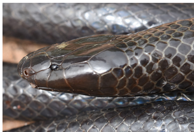
Figure 1 - Amblyodipsas unicolor . Spécimen de Moïssala (Tchad).

Dix-huit spécimens ont été étudiés, dont dix du Sénégal, quatre du Mali, trois du Tchad et un du Bénin (Tableau I). Huit spécimens (44,4 %) présentaient une ou plusieurs proies dans leur tube digestif. Pour les sept cas (38,9 %) où la proie était identifiable, il s'agissait de reptiles dans quatre cas (57,1 %) et d'amphibiens dans trois cas (42,9 %). Les reptiles étaient représentés par un serpent Typhlopide (écailles d' Afrotyphlops sp.), un amphispène ( Cynisca leucura Duméril & Bibron, 1839) et deux lézards indéterminés dont il ne restait que quelques griffes et écailles non digérées.